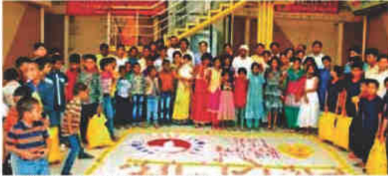
होमिओपॅथिक अकादमीच्या घटनेने परभणी येथे आयोजित दान महोत्सवात अनाथ बालकांसमवेत दीपावलीचा सण साजरा करण्यात आला. या प्रसंगीचे छायाचित्र

या काळात प्रत्येकाच्या चेहऱ्यावर आनंद फुलवा या उद्देशाने अनाथ बालकांसमवेत दिवाळी साजरी करण्यात आली. या कार्यक्रमास लागत येथील सेवान्वय प्रकल्पातील एचआयवी यापित मुले, परभणी येथील चार्टर्ड लाईन, जिल्हा निरीक्षण गृह, शासकीय बालगृहातील अनाथ मुलांनी सहभाग नोंदविला.