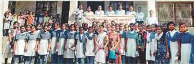
पारभणी : पेडगाव येथील शाळेत मुलींना सॅनिटरी पॅडची वाटप करण्यात आले.

पारभणी, प्रतिनिधी : होमिओपॅथिक अकेडमी ऑफ रिसर्च अँड चॅरिटीज पारभणी या संस्थेतर्फे सप्टेंबर (दि. २१) रोजी जिल्हा परिषद प्रशाळा पेडगाव व सिटी माध्यमिक विद्यालय पेडगाव येथील शाळेतील मासिक पाळीतील स्वच्छतेच्या जनजागृती कार्यक्रम आयोजित करण्यात आला होता. या कार्यक्रमात जि.प. माध्यमिक शाळा पेडगाव येथे इयत्ता ८ वी ते १० वी वीस एकूण १०० किशोरीयुवांनी मुलींची उपस्थिती होती. तर सिटी माध्यमिक विद्यालय पेडगाव येथे ८० किशोरीयुवांनी उपस्थिती होती.